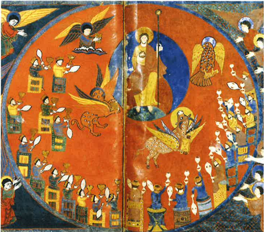
Beatus de Saint-Sever, Vers 1050-1072. La Vision du trône de Dieu ; l'adoration des vingt-quatre vieillards BnF, Manuscrits occidentaux, Latin 8878, f. 121v-122v