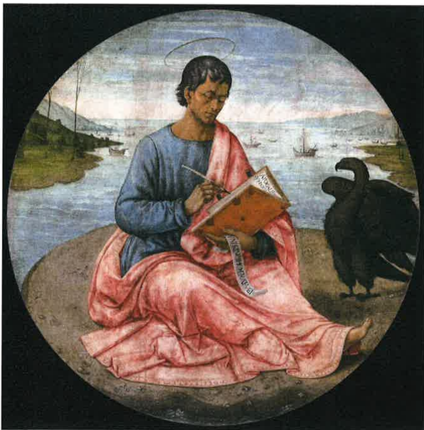
Domenico Ghirlandaio , Saint Jean l'évangéliste à Patmos , Musée des beaux-arts de Budapest.

F Celui qui est, qui était et qui vient. Amen !