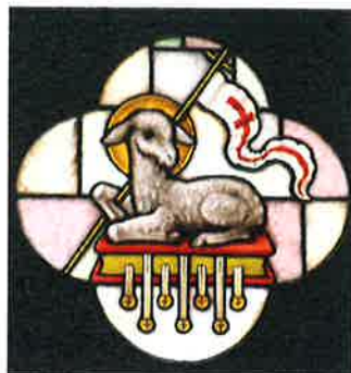
L'Agneau seul digne d'ouvrir les sept sceaux