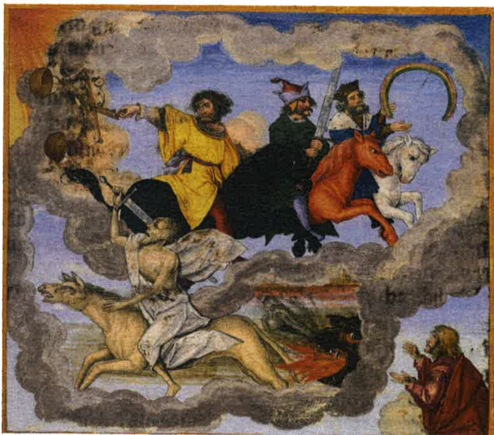
Mathis Gerung (1500–1570). Né à Nordlingen. Les quatre cavaliers de l'Apocalypse Illustration de la Bible d'Otto Heinrich. Blatt 288 Bayerische Staatsbibliothek

A La paix gardera nos cœurs et nos pensées en Jésus-Christ, Amen